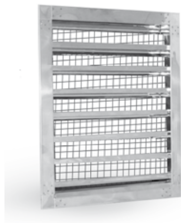
Rysunek nr 3

Do czyszczenia najlepiej używać zwykłej ciepłej wody z mydłem. Można też używać łagodnych detergentów ale wcześniej ich działanie należy dokładnie przetestować na małej powierzchni. Dla poprawienia wyglądu stal nierdzewną można konserwować dostępnymi na rynku środkami na bazie oleju.