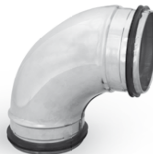
Rysunek nr 1 Kolano tłoczone ze stali kwasoodpornej BPL-K-90, stal 1.4301

Każda stal kwasoodporna w bardzo trudnych warunkach z czasem będzie miała ubytek masy ponieważ nie ma możliwości czyszczenia i odbudowywania się warstwy ochronnej.